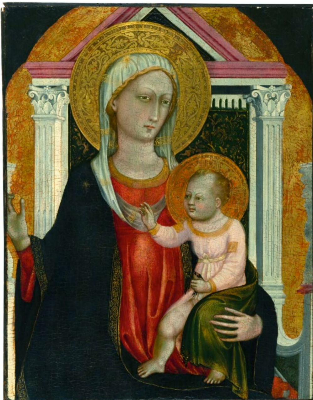
“Madonna col Bambino” BICCI DI LORENZO, inizio XV sec. tempera su tavola, cm 59,5 x 75 collezione della Banca